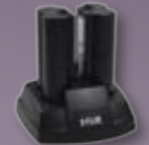
Cargador de batería